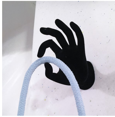
La Cascade (détail) : sculpture, Juillet 2019.