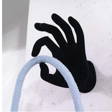
LaCascade(détail): sculpture, Juillet 2019.